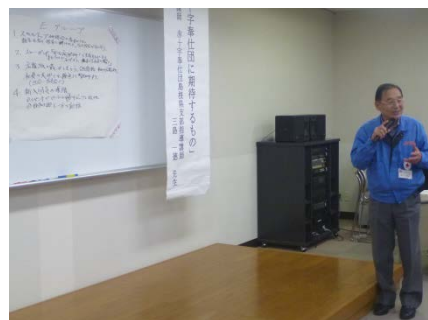
(話し合い結果をユーモア交えて発表)