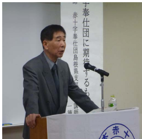
(熱い語る三島講師)