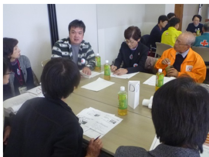
(活発に自分の団の様子を話し合う参加者)

平成 26 年 1 月 30 日（日）「まなびタウンとうはく」で奉仕団新任・次期リーダーを対象とした対象とした 1 日研修を行いました。26 団 42 人がスキルアップ研修会後の活動計画書を活用について意見交換しました。上手に活用し団を活性化ができた奉仕団からの報告があり参考になりました。午後は、三島一徳講師（島根県支部指導講師）から、災害救護活動が今後の奉仕団に求められる大きな活動であると激励いただきました。最後に人と人の固いつながり（ヒューマンチェーン）を大切に今後も奉仕団活動を行おうとの激励をいただきました。